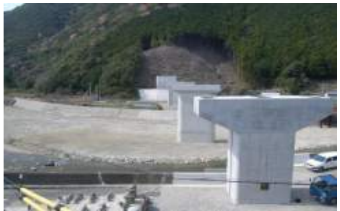
近畿自動車道紀勢線周参見川橋P1橋脚他工事