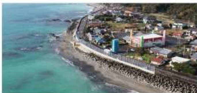
国道42号西向地区越波防止対策工事 (近畿地方整備局 紀南河川国道事務所発注) 現場代理人として従事しました