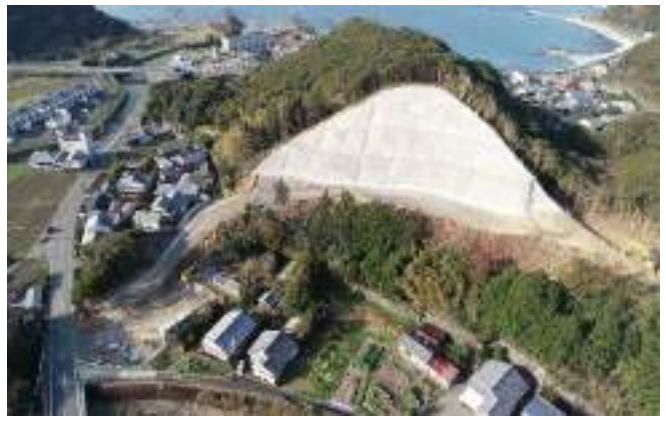
すさみ串本道路高富地区他工事用道路設置工事(下請工事)