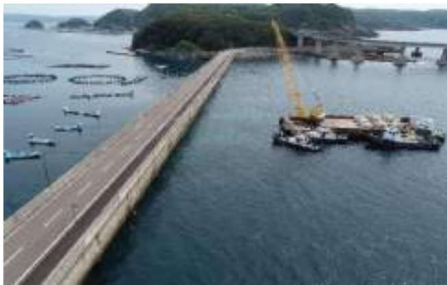
白野漁港災害復旧工事