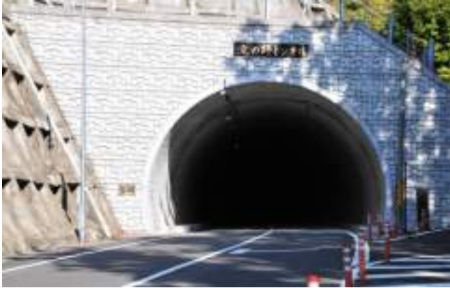
那智勝浦古座川線(仮称小川トンネル)道路改良工事