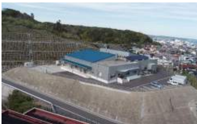
串本町学校給食センター新築工事