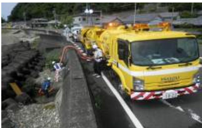
国道42号串本管内道路維持工事