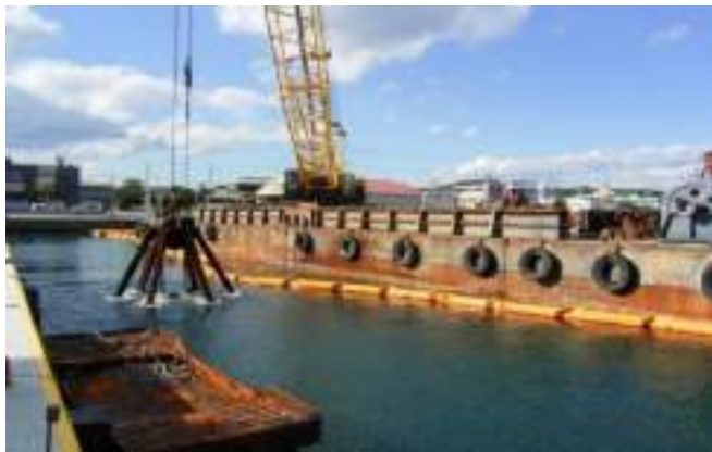
動鳴気漁港(東防波堤)機能保全(その2)工事