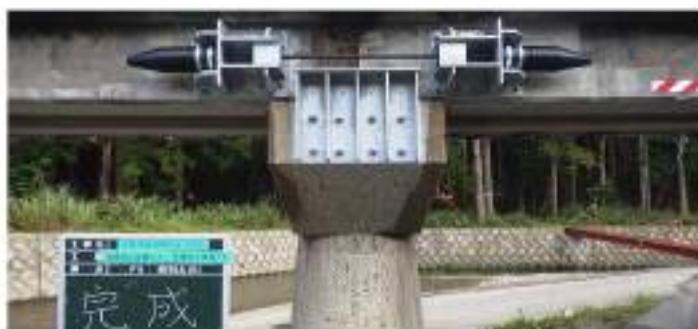
紀勢本線落橋防止工事