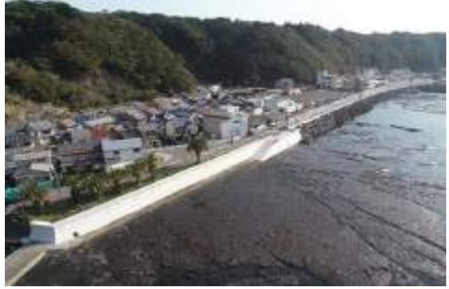
国道42号古座地区越波防止対策工事