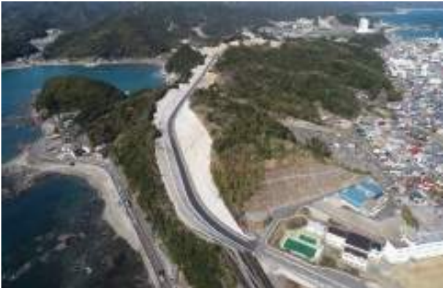
すさみ串本道路サンゴ台中央線地区改良工事