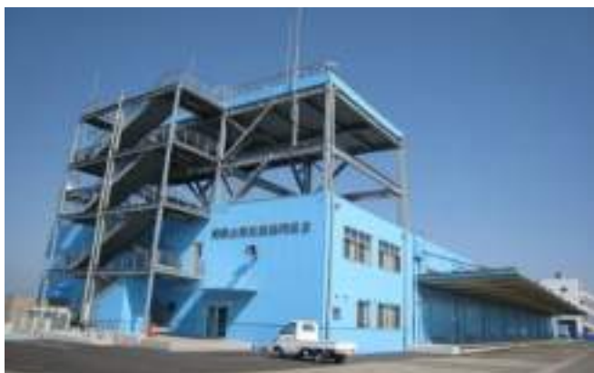
串本地区農林水産物集出荷貯蔵施設新築工事