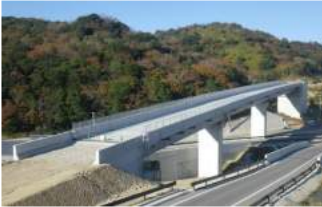
白浜温泉線(仮称才野高架橋上部)道路改良工事