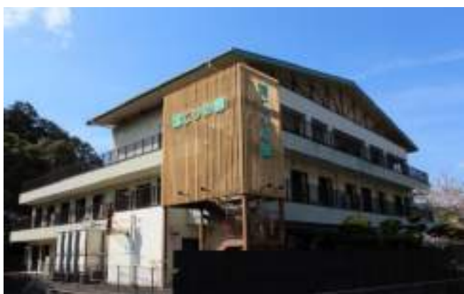
高瀬会地域密着型バーデンライフケアセンター 「湯ごりの郷」新築工事